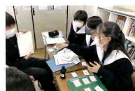
特色あふれる探究活動