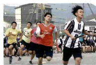
高校生活を彩る学校行事